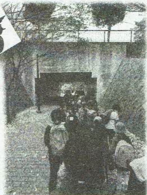
1・4・6年生グループ 神無公園へ！