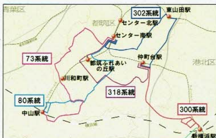
【都筑区内の生活交通バス路線】