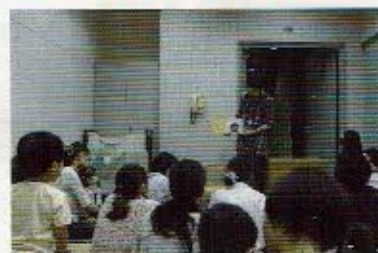
↑都筑図書館 くまさんのおはなし会