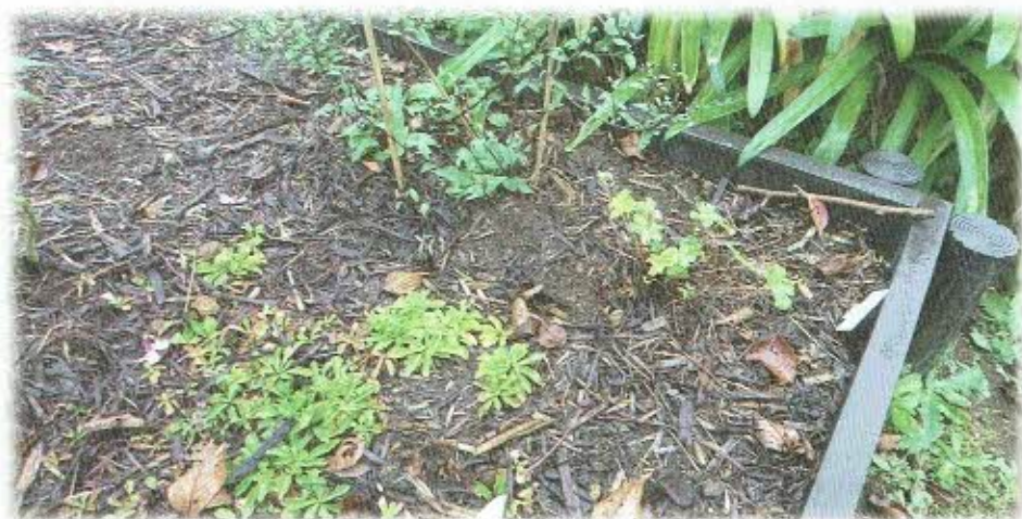
花壇にウッドチップでマルチングを行った例

土に直接日光が当たれば、近くの植物の根は強く影響で、水分の蒸発を抑制し、変化が緩和されるため、根となります。