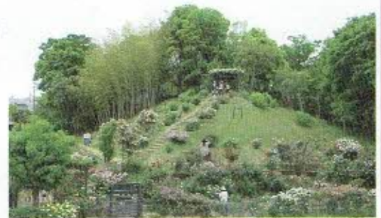
荇子田太陽公園（バラ園）全景

さらに、10月28日 一般社団法人日本公園緑地協会主催の「第36回都市公園等コンクール」においても「国土交通省都市局長賞」を受賞されました！ おめでとうございます！