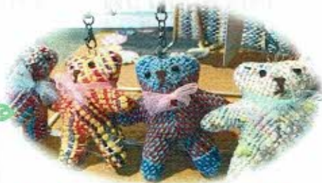
くさぶえさをり織り商品・くま