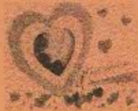
バレンタインカード