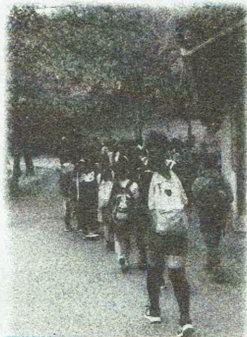
2・3・5年生グループ 牛久保西公園へ！