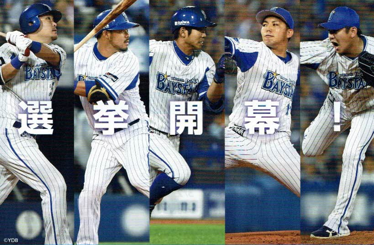
横浜市統一地方選挙PRチーム / 横浜DeNAベイスターズ