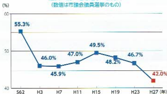
過去の統一地方選挙の投票率 (数値は市議会議員選挙のもの)

市議会議員選挙の投票率は、平成以降の過去7回の選挙では、いずれも40%台と低い投票率で推移しており、特に20代の若年層投票率は、20%台と平均を大きく下回る傾向が続いています。