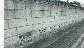
コンクリートブロック塀