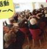
読み聞かせ かたらんらん