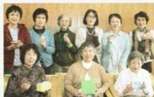
心を込めて作っています