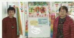
折り紙の文化も伝えます

■仲町台地区センター 大人と子どもがふれあう「場」 子どもと一緒に折り紙で鶴を折り、季節のイベントの飾りを作っています。子ども達を見守りながら心がほっと温まる時間を過ごしてみませんか？ 「つるっと仲町台」毎週水曜日 15:00～17:00 TEL 045-943-9191