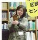
講演会 わすれない3.11 結ぶ