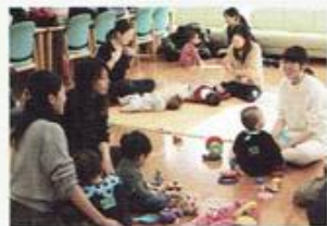
雨の日も遊べるね！

■都筑センター 子育ての情報交換、楽しく育児を！ 1階ふれあいルームで開催中！親子で楽しく過ごしながら、ママ同士の交流の場にもなっています。子育て支援グループあっぷりけのボランティアの皆さんが運営しています。 「子育てサロン」水曜日 10:00～12:00 TEL 045-941-8380