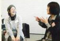
自分のことを話してみよう