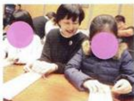
ワークショップ ミサンガ作り(予定)

日時：3/24(土)・25(日) 10:00～16:30(詳細はパンフレットで！) 場所：都筑区役所1階 区民ホール 紙芝居、ガラスアート、室内スポーツなど、子ども から大人まで楽しめるワークショップを行います。