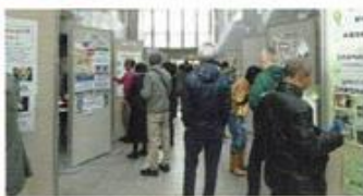
活動を紹介するパネル展示(昨年度の様子)

日時：3/23(金)～3/29(木) 場所：都筑区役所1階 区民ホール 市民活動、生涯学習団体が、 活動内容を展示します。