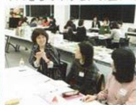
読書好きの都筑区を支えてくれています

つづきっこ読書応援団と都筑図書館共催の「学校図書ボランティア大交流会」に行ってきました。交流会ではグループワークを行い、「読み聞かせ」と「本の修繕」グループに分かれて活発にアイデアを出し合っていました。学校図書ボランティア活動の長い学校から工夫やアドバイスをもらうなど、お互いの情報交換の場