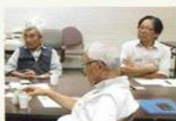
ふむふむ、これからの暮らし方

「生きがい！やりがい！Nice Guy★」10/3～10/31全5回終了 ～これからの楽しく過ごすために～ 場所：都筑区役所5階会議室