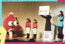
育児ミュージカル!

※詳細は1月に発行するパンフレットをご確認ください。パンフレットは区民活動センターのホームページにも掲載します。