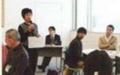
どんなイベントが行われるか楽しみ!

「オリンピック・パラリンピック・英国ホストタウン支援 事業について」をテーマに施設同士で連携できそうな事業 のアイデアを出し合いました。来年度は、2020年のオリ ンピック・パラリンピックに向 けたイベントが都筑区内のあ ちこちで開催される予定です。 どうぞお楽しみに!