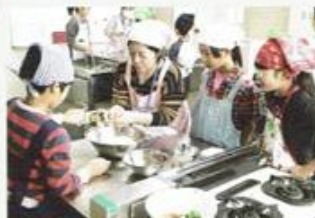
「こうやって、ああやって」「へえ～」

■中川西地区センター 寺小屋で子どもと一緒に学び合う 小学生向けに卓球、お料理、天体観測、昔遊びなど、楽しく学ぶ寺小屋を開いています。教えるのは街の先生です。ボランティアとして関わっていただける方募集中です。 「街の寺小屋」月1回土曜日 TEL 045-912-6973