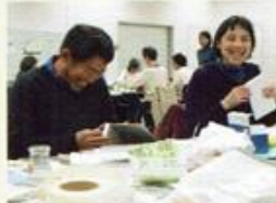
もう一度、手に取ってもらうために!

基礎知識から実習まで学べ る初心者向けの講座。定員 を超える参加者が集まりました。 今後、修理ボランティアと して地域の施設での活躍が 期待されます。