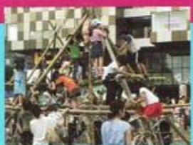
こどもみらいフェスティバル!