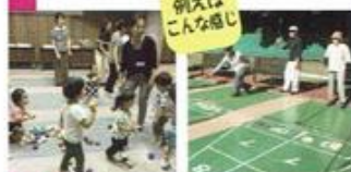
例えは こんな感じ

期間中に都筑区内のあちこちで開催される市民活動、生涯学習、 サークル活動に、区民のみなさんが「1日体験参加」することが できます！福祉、音楽、子育て、スポーツ、健康・いろいろな 分野の活動をこの機会にぜひお試しください！