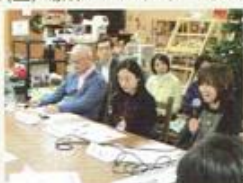
熱い情報交換の場になりました